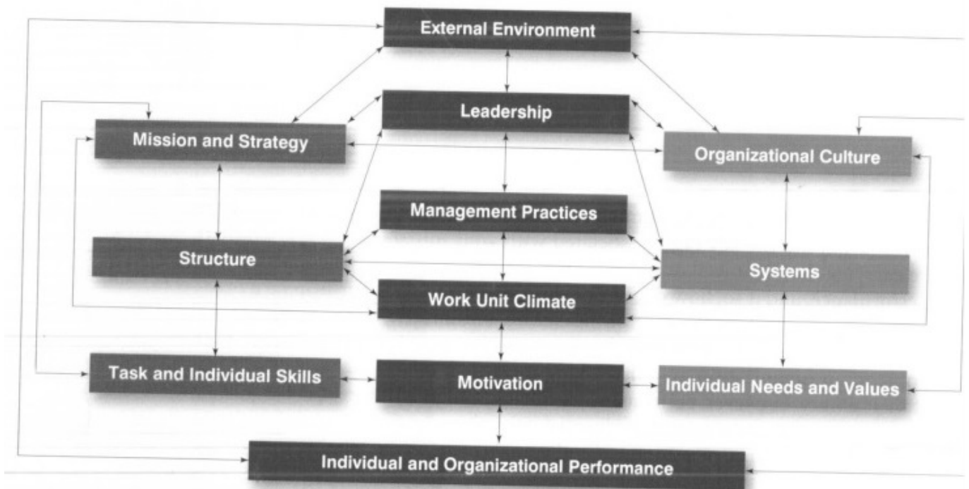
FIGURE 8.1 The Burke–Litwin model

Keď sa organizácia snaží rozvinúť alebo významne zmeniť, transformačné faktory sú aktívujúce, často nabádané zmenou v externom prostredí. Zmeny v týchto transformačných faktoroch preniká cez menej škálové („smaller -scale“) procesy k individuálnemu zamestnaneckému výkonu. Model ilustruje, že v zmysle dosahovania strategických cieľov organizácie, ľudia v organizácii musia jednať v zmysle, ktorý prispieva k týmto cieľom. Kľúčovým procesom v prekladaní stratégie do individuálneho správania je výkonový manažment. Strategický výkonový manažment je o prepájaní cieľov individuálnych výkonov s cieľmi organizácie, určujúc či jedincove výkony sú uspokojivé vzhľadom na ciele a intervenujúc, ak nie sú v zhode. Výkonový manažment tak zahŕňa hodnotenie pracovného výkonu, ale i rozvoj zamestnancov. Dve úlohy výkonového manažmentu sú: - Meranie výkonu